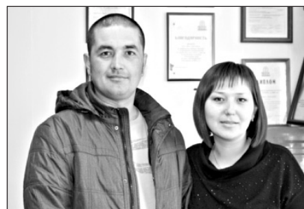
Д.и Л. Круговых Окна «Д.Е.К.А.»