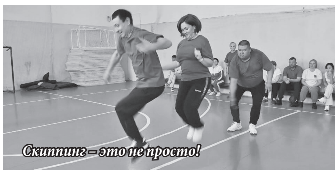
Скиптинг – это не просто!