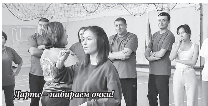
Дартс – набираем очки!