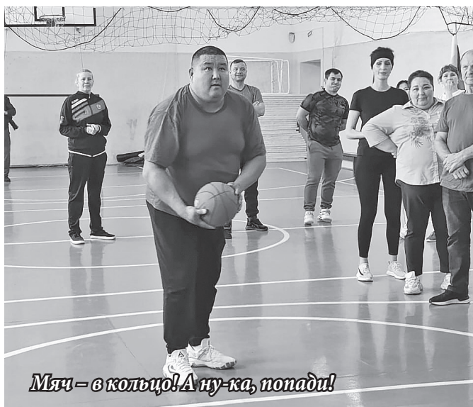
Мяч – в кольцо! А ну-ка, попади!