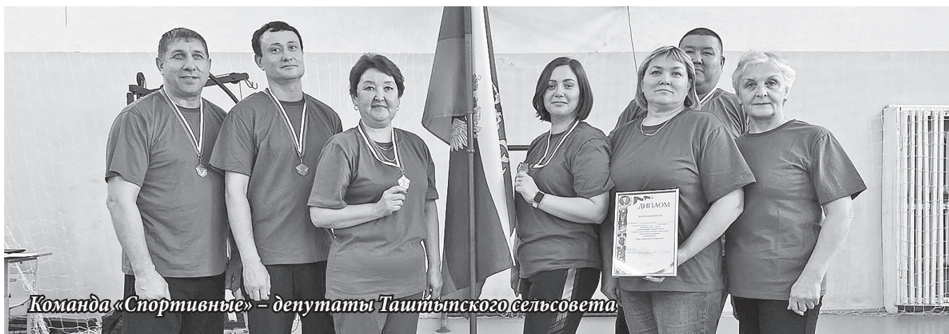
Команда «Спортивные» – депутаты Таштынского сельсовета.