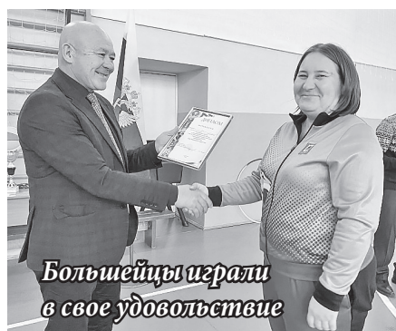
Большейцы играли в свое удовольствие