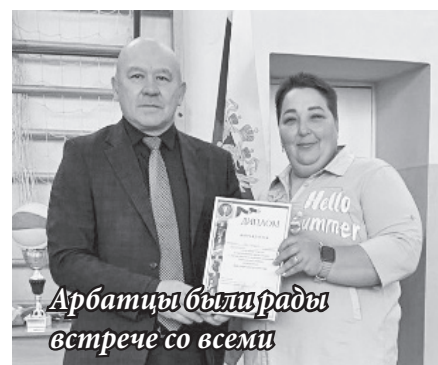
Арбаты были рады встрече со всеми