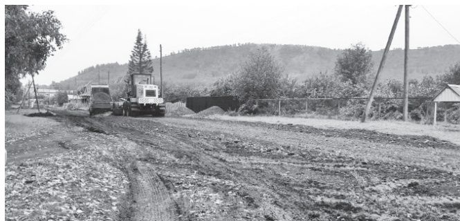
Ремонт улицы Советская продолжается. Идет отсыпка и грейдирование проездов в самом начале улицы.