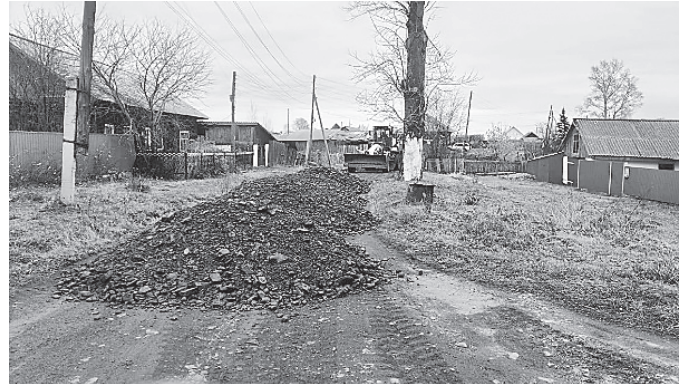
Отсыпана и отгрейдирована ул. Березовая