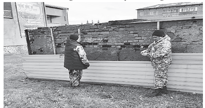
На площади РДК демонтирована Доска Почета. На территории будет заложен сквер Трудовой Славы.