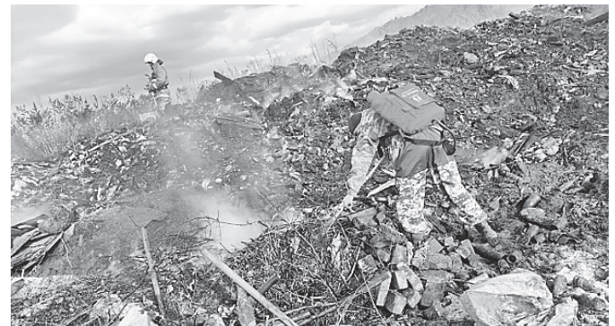
Добровольная пожарная дружина Таштынского сельсовета помогла в тушении пожара, возникшего на территории свалки