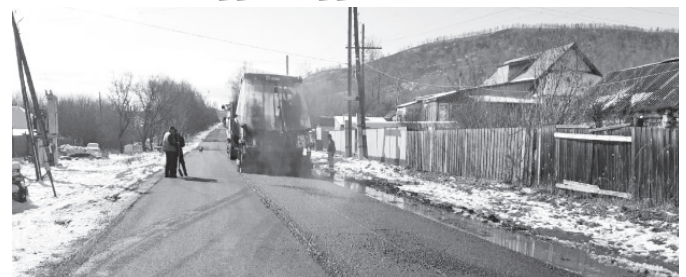
Ул. Коммунальная – дорога хорошая. На ул. Советской завершается асфальтирование.