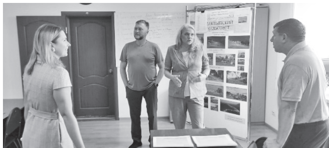
Презентация проекта «Тропа монаха»