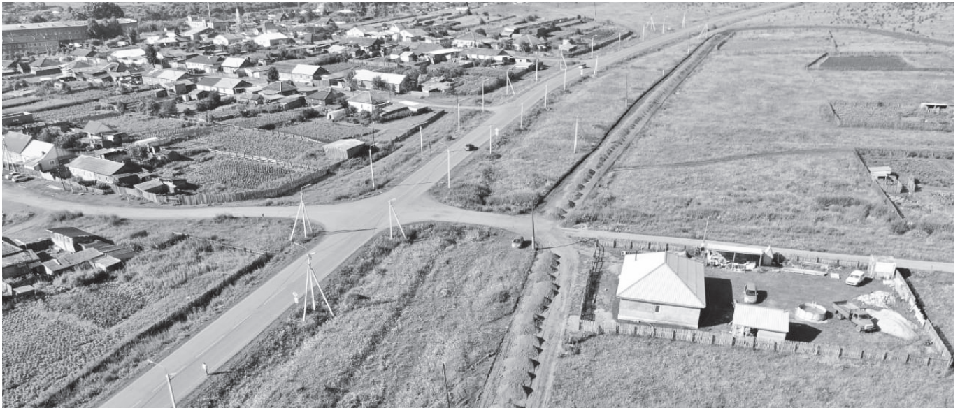
Идет отсыпка дорожного полотна на улицах малоэтажной застройки на левобережье