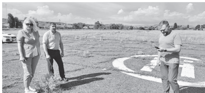
На взлетно-посадочной полосе аэродрома