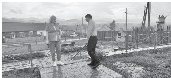
В сквере «Начало казачества»