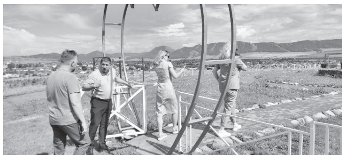
На АРТ-площадке «Семья»