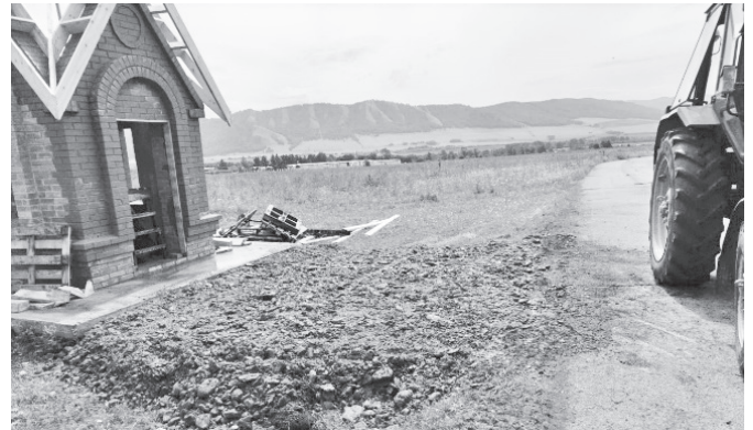
Возле сельского кладбища отсыпается подъезд к часовне