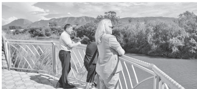
На Набережной с. Таштып