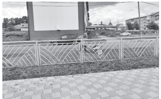
На Набережной, где установлен детский игровой комплекс для малышек готовится «подушка» для укладки мягкого покрытия