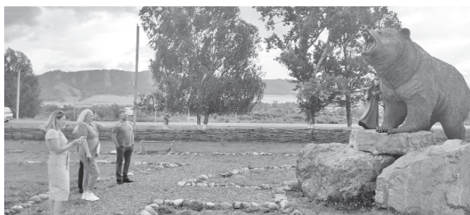
На гостевой площадке «Изеннер»

По итогам визита достигнуты договоренности о детальной проработке проекта «Тропа Монаха» и изысканию средств для его полной реализации, а также о пробной посадке легкомоторной авиации на летное поле с. Таштып.