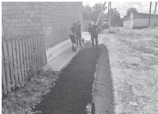
Преображается дворовая территория по ул. Ленина, 46-48.

Участие в программе «Комфортная городская среда», в которой Таштыпский сельсовет участвует уже ни один год, предполагает благоустройство двора. Работы выполняет Таштыпское ДРСУ.