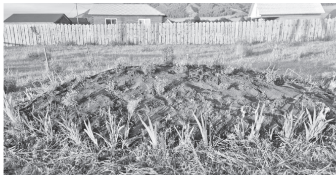
Жители ТОС «Новая жизнь» навели порядок в сквере Памяти павшим на СВО "Остров-Z".