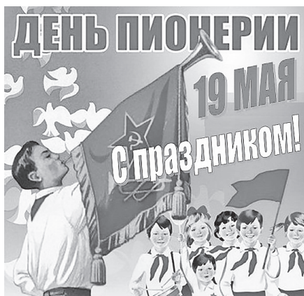
Таштыпское местное отделение КППФ

Патриотизм Пионерия воспитывала не показной, она пропитывала нас этим чувством, оно жило в каждой нашей клеточке. Хотелось бы, чтобы пионерское движение набирало силу год от года.