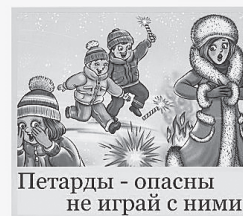
Петарды - опасны не играй с ними