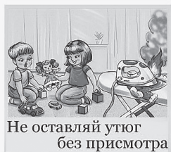
Не оставляй уют без присмотра