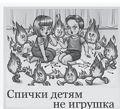
Спички детям не игрушка