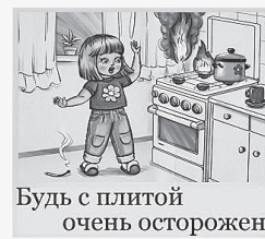
Будь с плитой очень осторожен