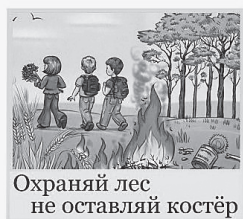
Охраняй лес не оставляй костёр