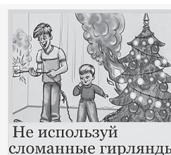
Не используй сломанные гирлянды