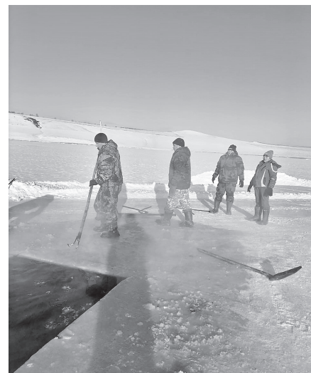
Несмотря на сильные морозы, началась заготовка льда для Снежного новогоднего горodka