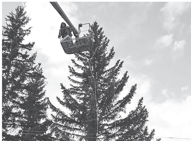
Таштып готовится к новогодним праздникам Украшаются улицы, развешиваются гирлянды