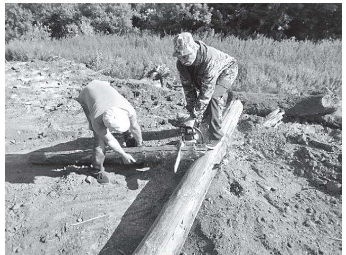
Вдоль Набережной на ул.Советская убираются покосившиеся столбы, принадлежащие связистам