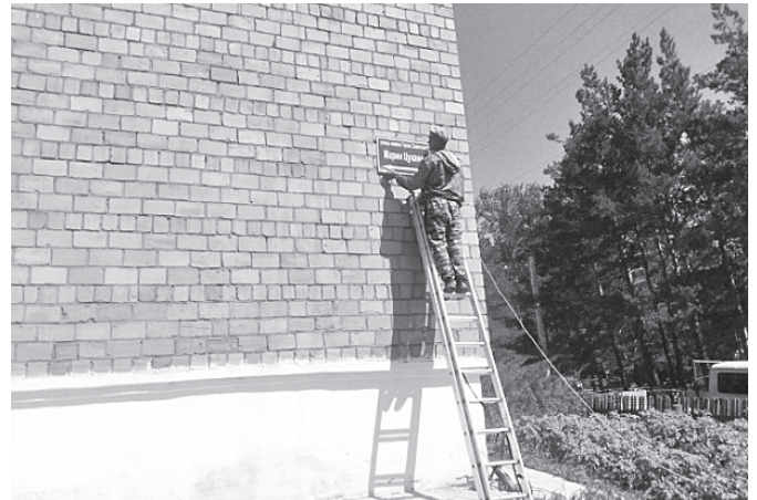
На улице имени Героя Советского Союза Марии Цукановой размещают новые адресные таблички, приобретенные на средства Гранта, полученного ТОС «Инициатива»