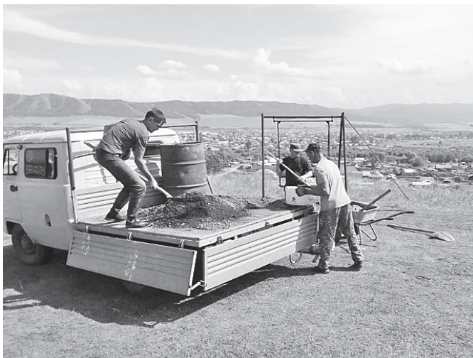
На горе Любви работниками Таштыпского сельсовета установлены качели