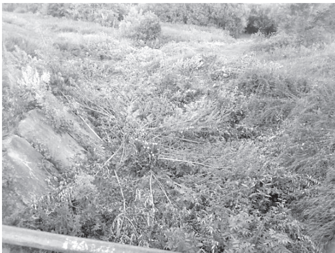
Работники Таштыпского сельсовета освобождают горно-ловчий канал от растительности