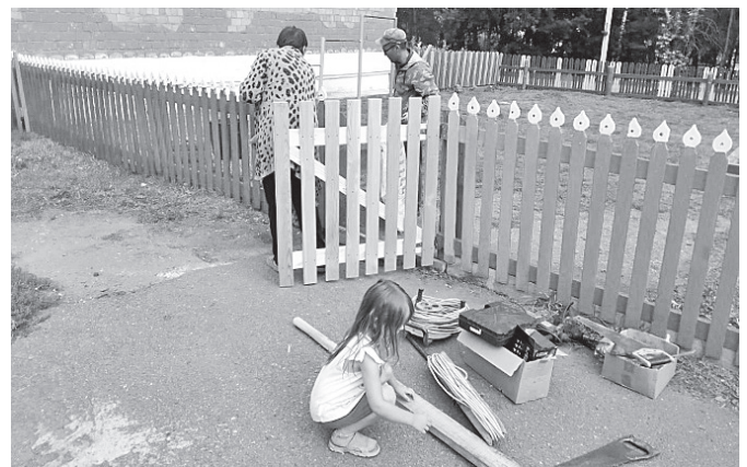
ТОС «Инициатива» заканчивают ремонт своей детской игровой площадки