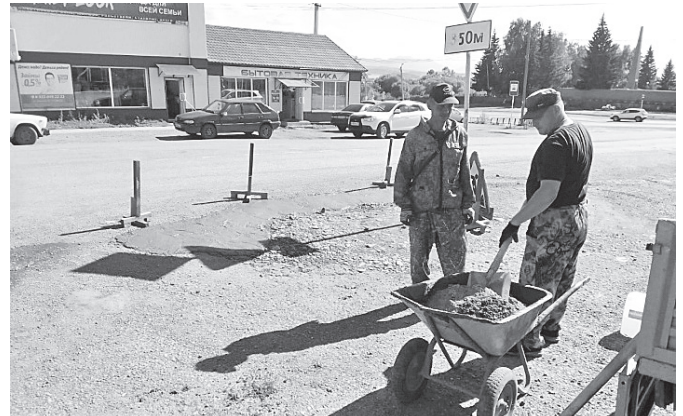
Работники Таштыпского сельсовета проводят ямочный ремонт дорожного полотна на улицах: Советская, Ленина, Луначарского, Энгельса, Войкова. Основные улицы села готовят к дорожной разметке.