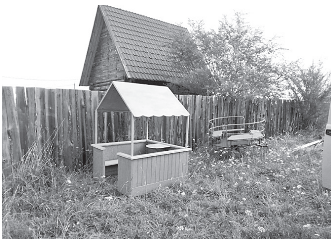
Завезли часть оборудования на детскую площадку ТОС «Новая жизнь» (ул. Трудовая)