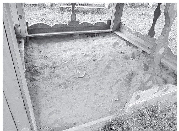
Песочница на ТОС «Октябрьский»

Продолжается ремонт и благоустройство детских игровых площадок. Помощь в ремонте оказывают работники сельсовета. Жители ТОС «Инициатива», «Новая жизнь», «Октябрьский» принимают в этом активное участие. С каждым днем площадки преобразуются, становятся красивее и уютнее.