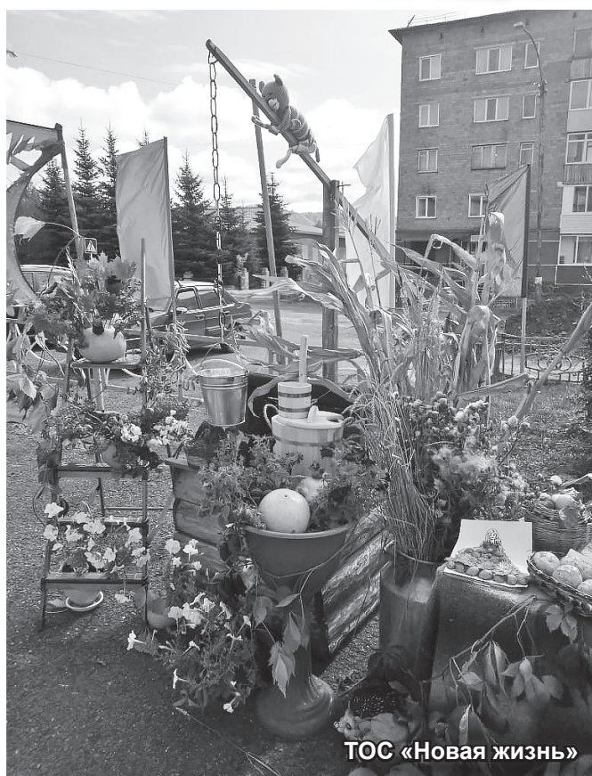
ТОС «Новая жизнь»