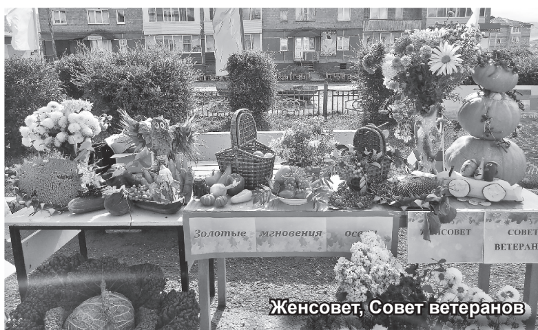
Женсовет, Совет ветеранов