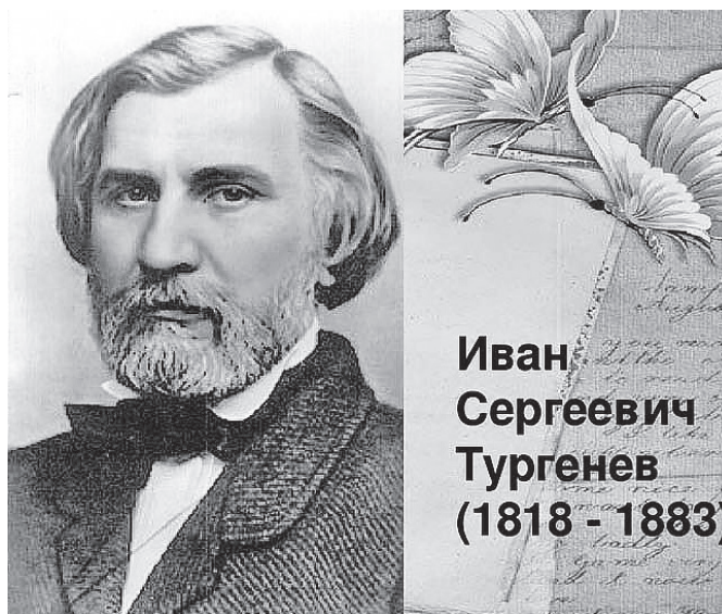
Иван Сергеевич Тургенев (1818 - 1883)

Именно благодаря стараниям Ивана Сергеевича Тургенева были переведены лучшие произведения Пушкина, Гоголя, Лермонтова, Достоевского, Толстого.