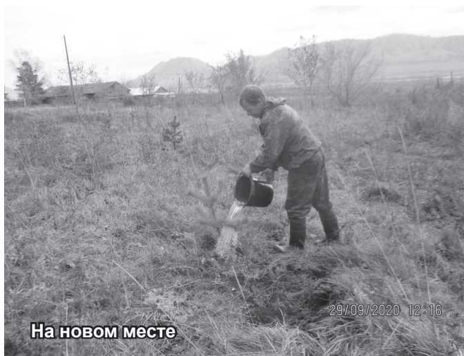
На новом месте