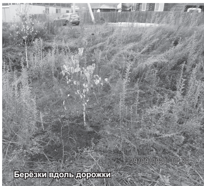
Берёзки вдоль дорожки