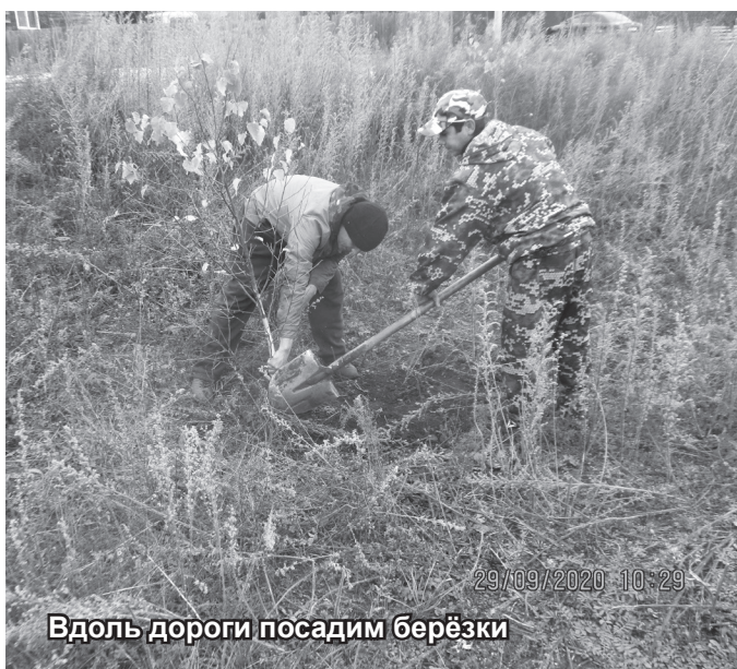
Вдоль дороги посадим берёзки