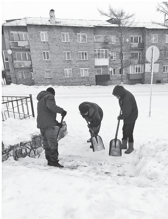
На улицах села идет очистка мест общего пользования от снега