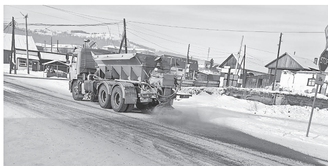
Регулярно проводится подсыпка дорог