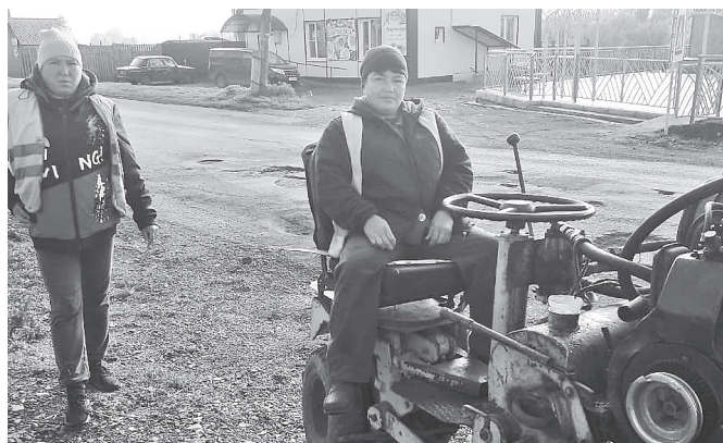
На следующий год реконструкция ул. Советская полностью будет завершена.