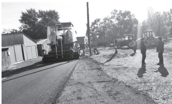
Параллельно началась работа по ямочному ремонту. Выбоины на дорожном полотне будут заасфальтированы.