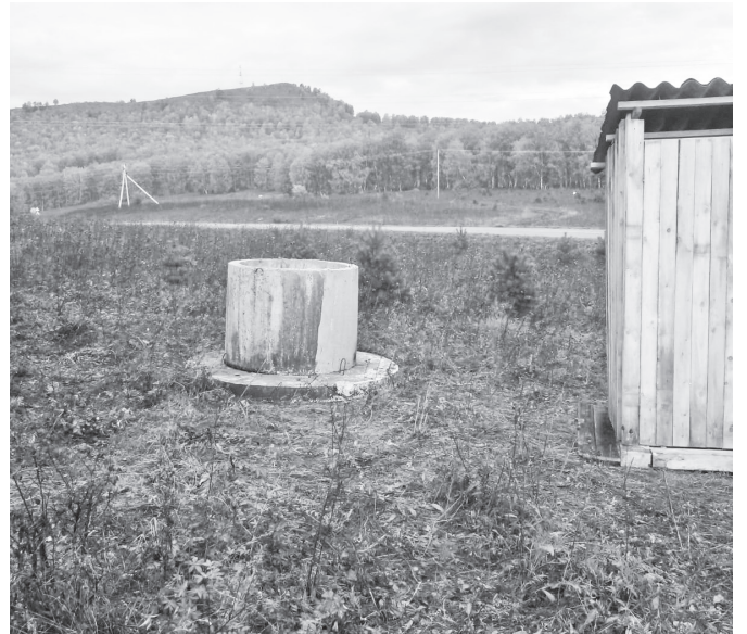
вета устанавливают МАФы, окрашивают ограждение. Построен туалет и появился мусорный бак. Идет замена мусорных контейнеров на территории МКД. Уничтожаются заросли конопли и травостоя