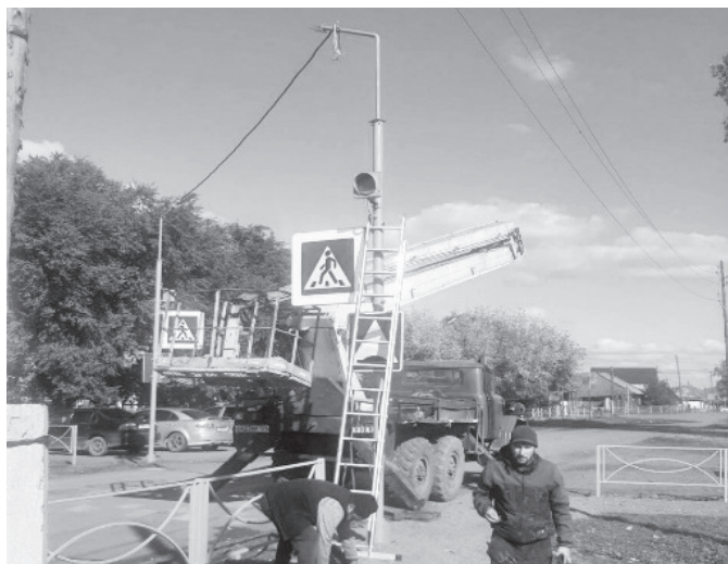
В с. Таштып подрядная организация приступила к оборудованию пешеходных переходов светофорами и освещением.