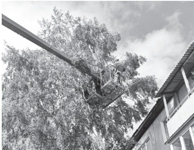
Рабочей группой Таштыпского сельсовета ведется работа по благоустройству села: спиливаются деревья и ветви, мешающие обзору. На АРТ- площадке «Семья» проведен субботник. Специалисты и рабочие сельсо-