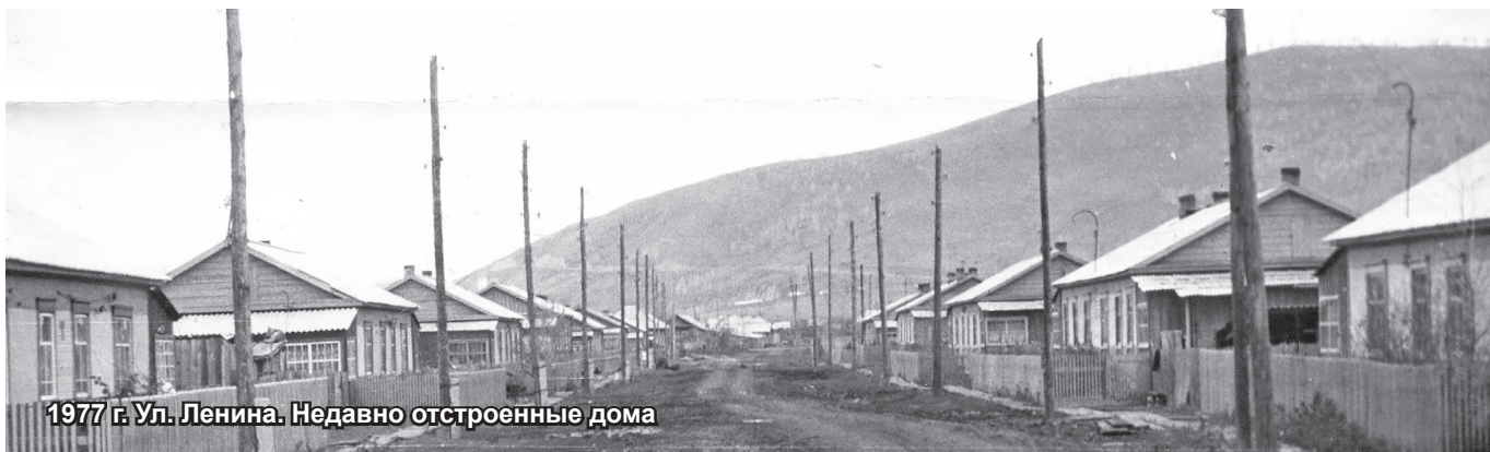
1977 г. Ул. Ленина. Недавно отстроенные дома