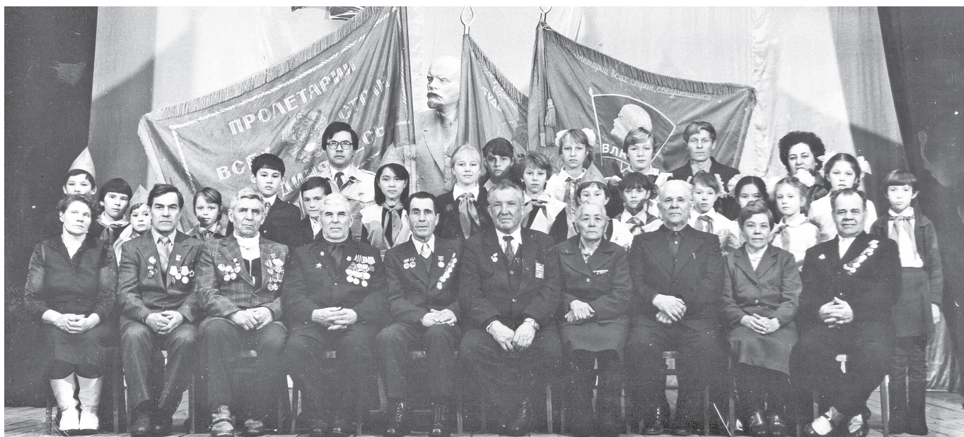
1980 год. 110-я годовщина со Дня рождения В.И. Ленина