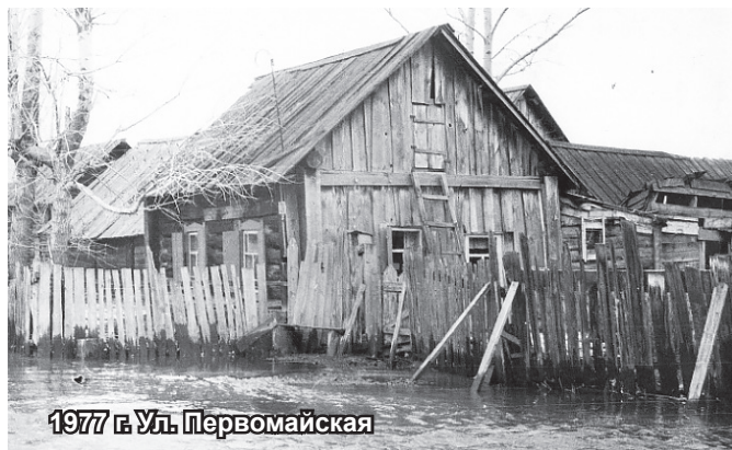
1977 г. Ул. Первомайская