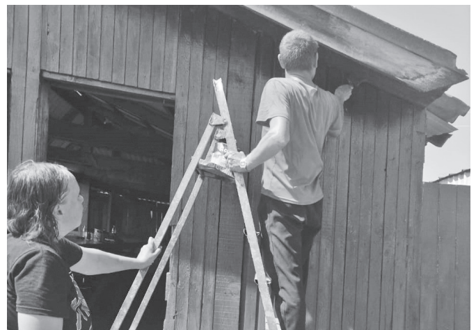
Идет покраска малых архитектурных форм и места ярмарочной торговли