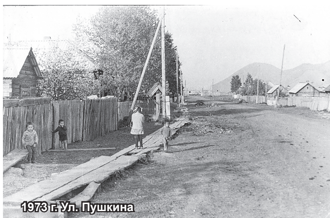
1973 г. Ул. Пушкина