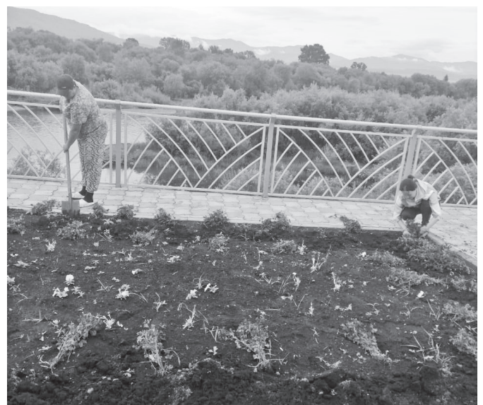
Высаживается рассада цветов на Набережной