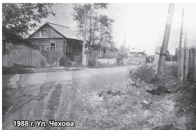
1988 г. Ул. Чехова