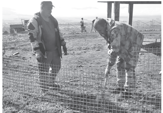
Работа «кипит». На горе Любви появится АРТ-площадка «Семья» для отдыха жителей и гостей села