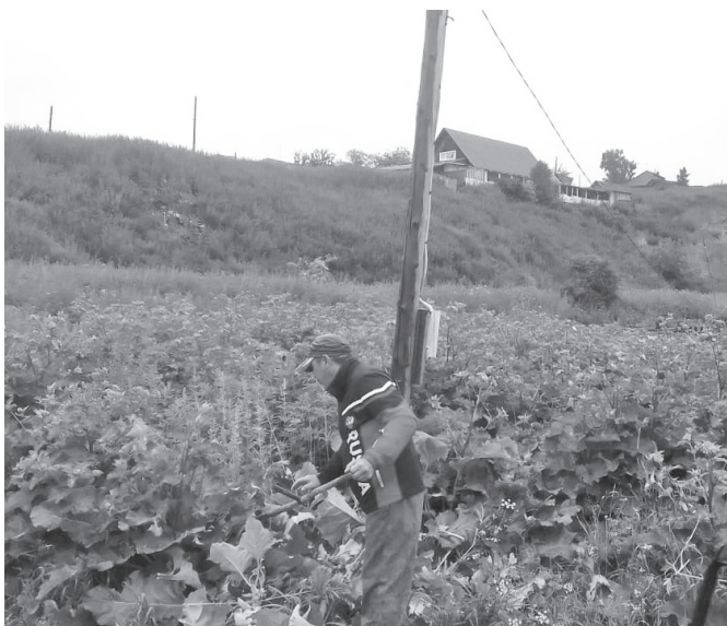
Выкашиваются заросли конопли