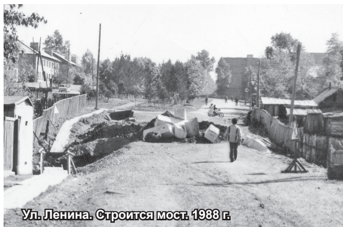
Ул. Ленина. Строится мост. 1938 г.