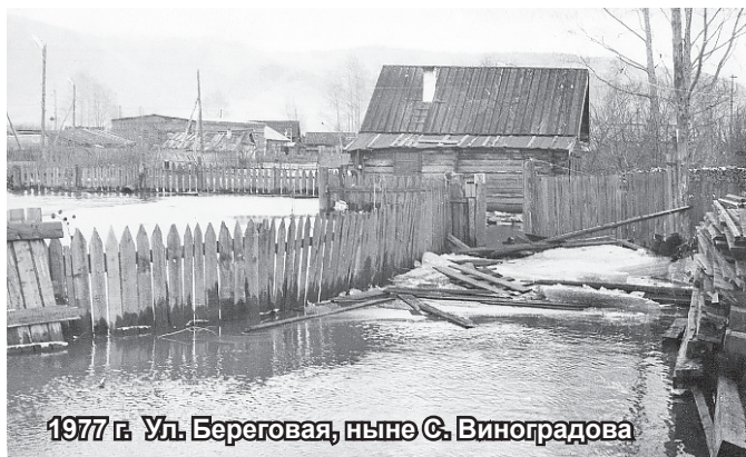
1977 г. Ул. Береговая, ныне С. Виноградова