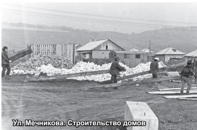
Ул. Мечникова. Строительство домов