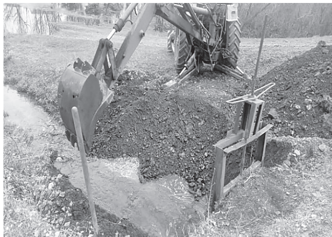
На дамбе в районе улицы Шама открыли шлюзы