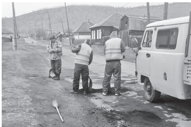
Ремонт дорожного полотна на улице Советской.