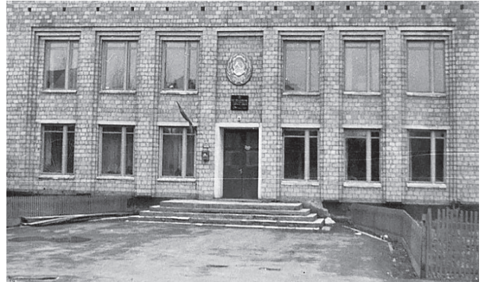
Здание сельсовета по улице Ленина, в котором сегодня размещается районный суд