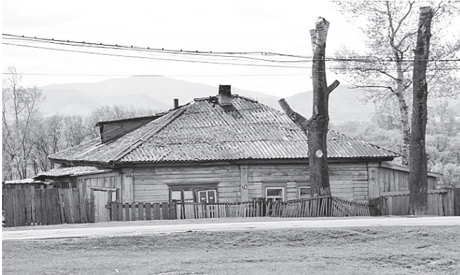
Старое здание сельсовета по улице Советской (сейчас на его месте Набережная)

Исполком Таштыпского сельского Совета крестьянских и красноармейских депутатов образован 1 апреля 1920 года и подчинялся Таштыпскому волисполкому.