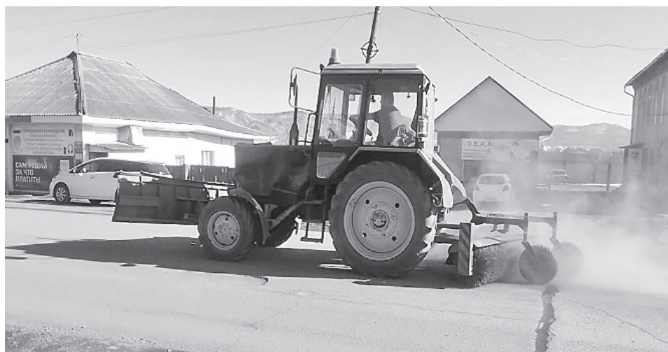
Идет ремонт дорожных знаков и уборка щебенки (подсыпки) с проезжей части дорог