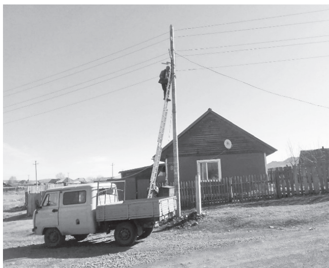
Замена перегоревшего светильника на ул. Р. Люксембург