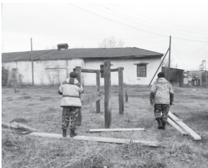
Ведется ремонт станков для проведения ветеринарной обработки и чипирования КРС