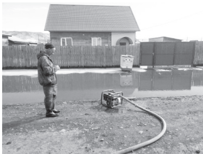
Работники Таштыпского сельсовета работают на улицах села правобережья, откачивается талая вода