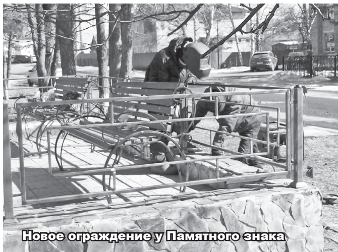
Новое ограждение у Памятного знака

Немало важной оставалось благоустройство и освещение улицы имени Героя Советского Союза М.Н. Цукановой. На средства гранта были закуплены адресные таблички на каждый дом и указатели о том, что данная улица носит имя Героя Советского Союза. Так же на данной улице проведено уличное освещение.