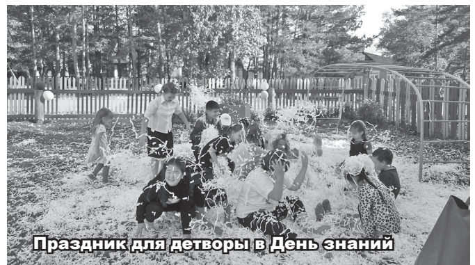
Праздник для детворы в День знаний

Село Таштып является административным центром, в связи с этим наблюдается большое количество машин. Не