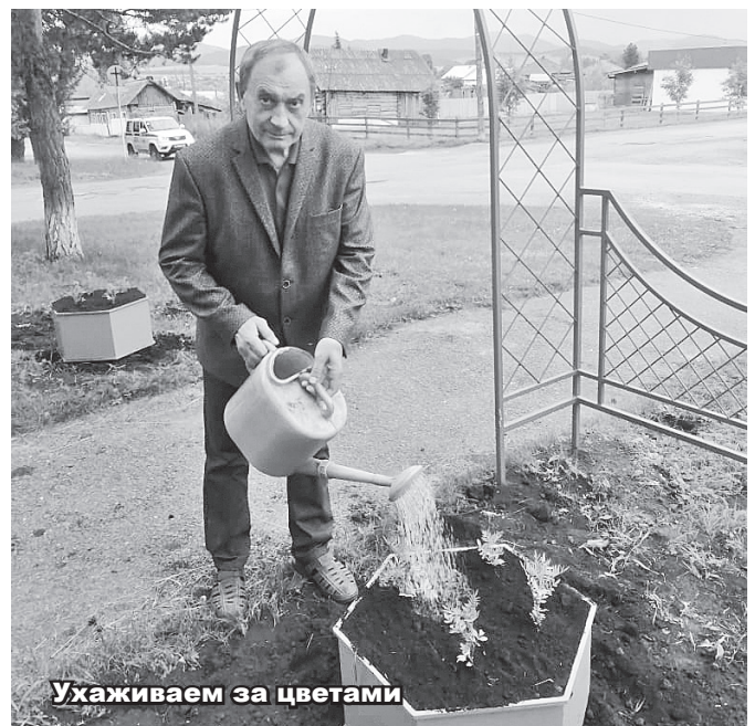
Ухаживаем за цветами

У инициативных жителей ТОСа возникло новое желание – улучшить эстетический облик села. Чтобы хорошая идея воплотилась в реальность, активисты ТОС принимают участие в республиканском конкурсе на предоставление грантов. Проект «Живи, цветы, село родное!» в 2021 году становится призером и получает 720 тысяч на реализацию своей мечты.