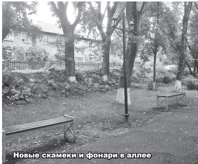
Новые скамейки и фонари в аллее

Жители ТОС «Инициатива» личным примером показывают заботу о родном селе, а также стараются благоустроить наше село, взаимодействуя с администрацией Таштыпского сельсовета и жителями села.