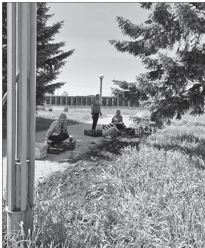
Более 1000 корней цветов высажено на всех клумбах села