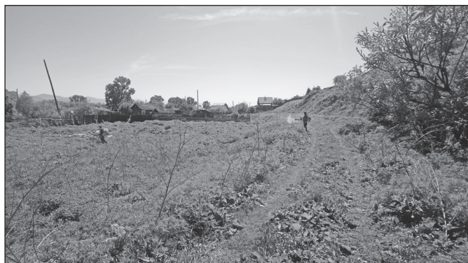
Уничтожаются дикорастущая конопля и сорняки