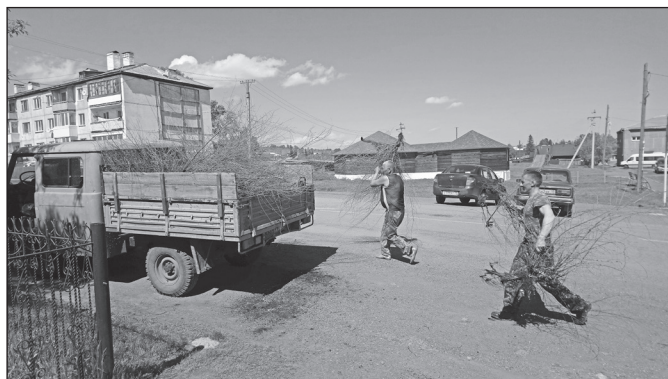
Убираем старые засохшие кустарники