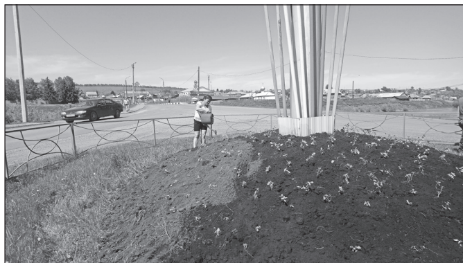
Полив рассады цветов ежедневно