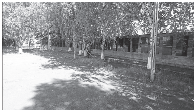
Выкашиваем траву в Парке Боевой славы