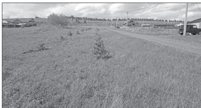
Новые насаждения сосенок вдоль ул. С.Майнагашева ТОО «Саяны»