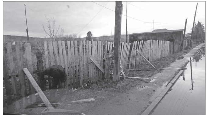
Устанавливаем новое ограждения