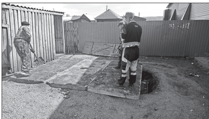
Строится общественный туалет