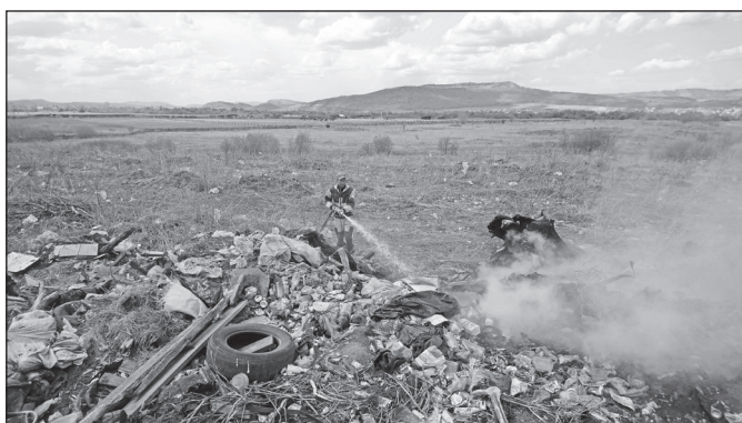
Приходится тушить несанкционированные свалки