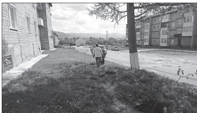
Рябина у многоквартирных домов по Луначарского