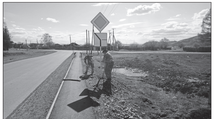
Установка дорожных знаков