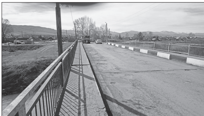
Ремонт на мосту