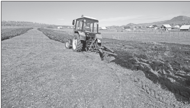
Прокладка минерализованной полосы