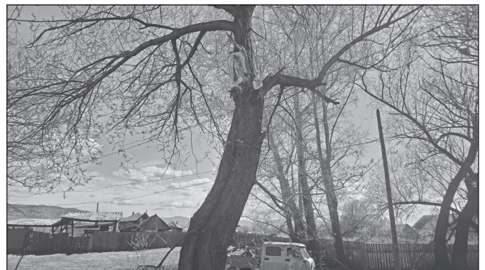
Уборка старых деревьев