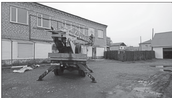
Убираем старые банеры