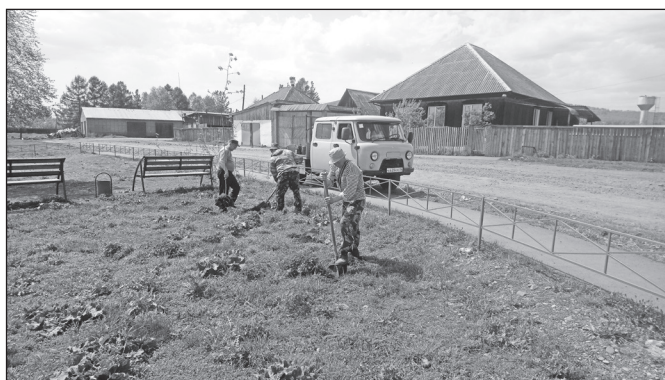
Озеленение территорий общественных мест