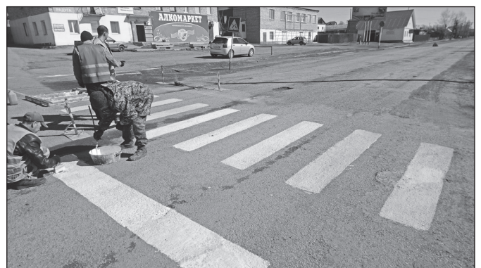
Обновление пешеходных переходов