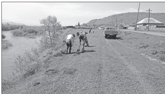
Посадка деревьев вдоль берега реки