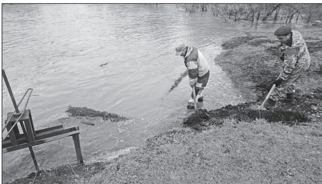
Работа на шлюзах в паводок