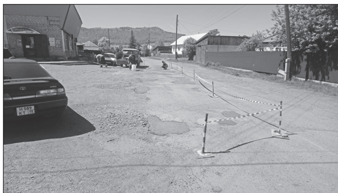
Идет ямочный ремонт на ул. Карла Маркса