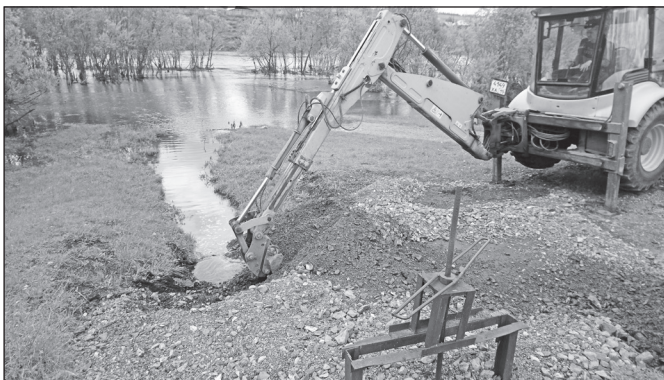
Отвод воды на ул. Щетинкина и Шама в паводок